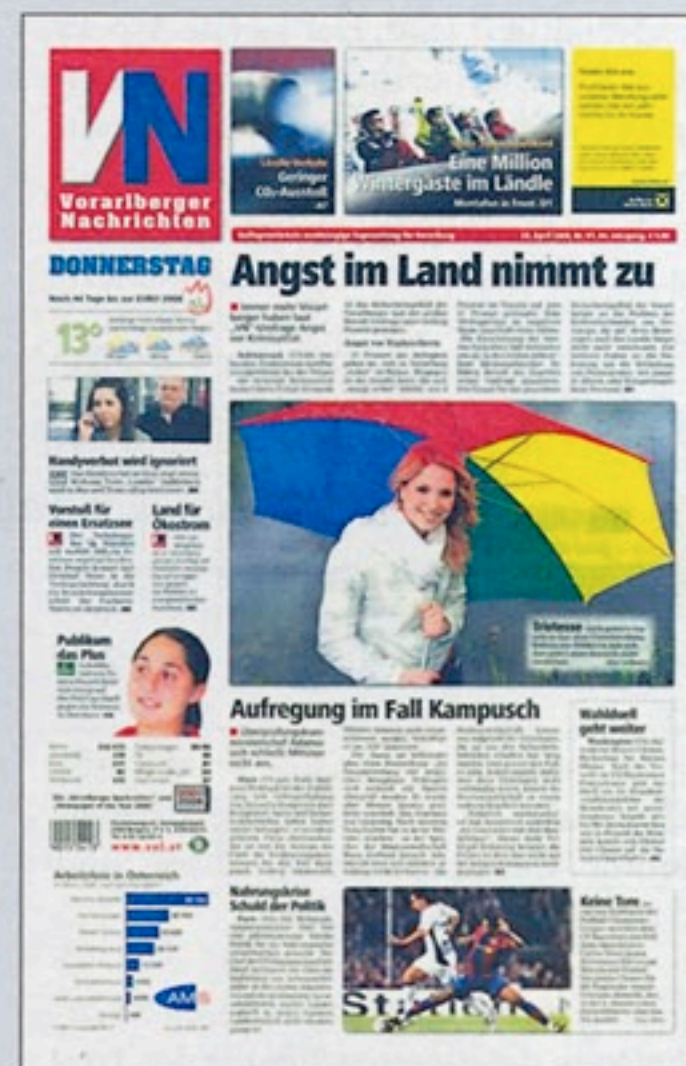
„Vorarlberger Nachrichten“: Tageszeitung mit reichhaltiger Anbindung im Netz

len Bereich seine Entwicklungsfähigkeit aufgibt, liefert sich Technologiekonzernen wie Yahoo oder Google aus“, sagt er und verweist auf Zeitungen in den USA, die aus Angst, sich selbst zu schädigen,